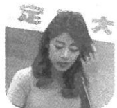
定 少なく、所定労働時間を超えて組むソフトが当たり前だった。

だが、組合でそれはいいけないと知った。職場全体で共有するために、労務説明を要求し、開催のこび。体制を組む人も一緒に検討していきたい。