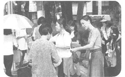
※7/1この指とまれ宣伝の様子

田代分会では3・16ス トで改めて非正規職員の 組織化を考え、学生パー ト以外全職員加入に成功。 北守山支部では未組織訪 問を大切にし、めいほく 障害部分会内で未組織だっ た職場に支部として訪問。 後日、めいほく障害部分 会も訪問し、2名の拡大 につながりました。刈谷 のこぐま・第二こぐま分 会は、日々の分会へのお 誘いも丁寧にして拡大。 あつた分会では団交がぎつ かけで拡大してました。 公立の民間移管や新園な ど事業拡大もあります 各支部・分会が、これま で歩みを止めずに、要求 実現のため、組織化を意 識してきた結果です。