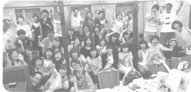
※6/10 岐阜はだしっこ交流会

福祉・保育職場には、 こんなに仲間がいるんだ！ 2017年6月、東海 地本結成からの念願だっ た「1000人地本」、つ いに達成することができ ました！