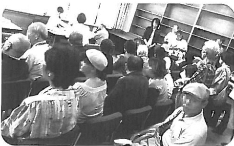
会場を埋める不服審査を求める人々

利用者、家庭でも生活保護を受けている方がいます。生活保護の問題は私たち福祉労働者のすぐ近くにある問題です。 また、生活保護が社会保障等の基準にされるため、そこが引き下げれば、最低賃金、保育料や医療費、税制など、私たちの暮らしに大きな影響を及ぼします。 生活保護は憲法25条の具体化で、これが機能しないということとは、憲法25条そのものが守られない、「憲法違反」の社会とすることです。私たちみんなの問題です。今後とも支援の輪を広げていきましょう。