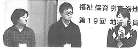
福祉 保育 労働 地海委員 第19回